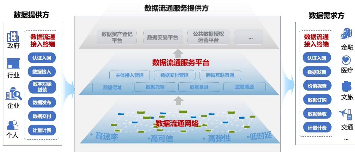
图 4 数联网功能架构图

数联网由数据流通接入终端、数据流通网络、数据流通服务平台构成，提供一点接入、广泛连接、标准交付、安全可信、合规监管、开放兼容的数据流通服务。