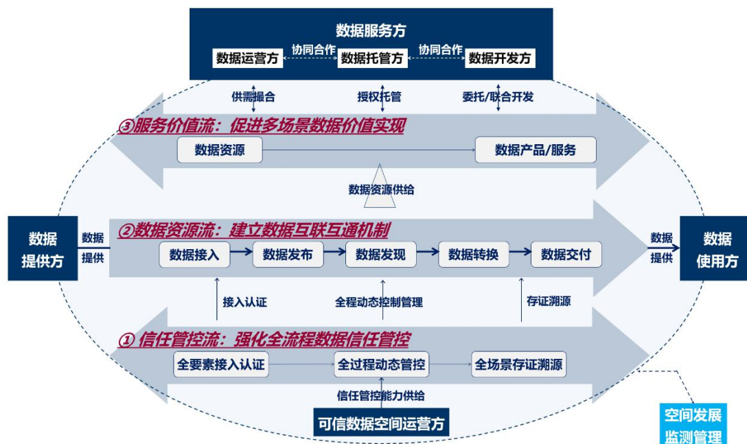
图 2 可信数据空间架构图

可信数据空间是基于共识规则，联接多方主体，实现数据资源共享共用的一种数据流通利用设施，是数据要素价值共创的应用生态，是支撑构建全国一体化数据市场的重要载体。可信数据空间须具备数据可信管控、资源交互、价值共创三类核心能力。